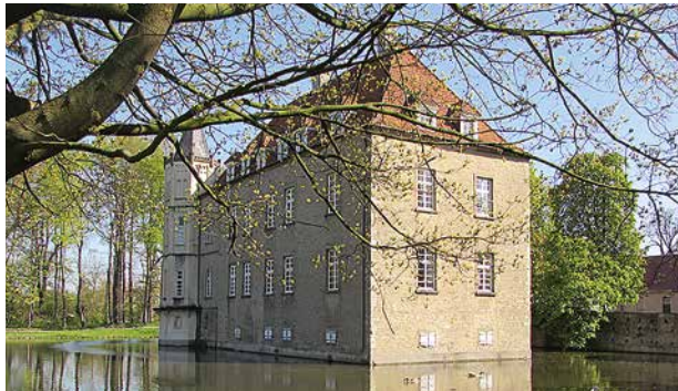
Schloss Heeren, Kamen, 70 bis 120 Personen