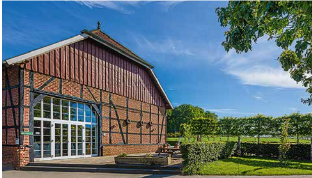
Hof Bleckmann, Werne, 40 bis 140 Personen

Weitere außergewöhnliche Veranstaltungsorte finden Sie auf www.stolzenhoff.de