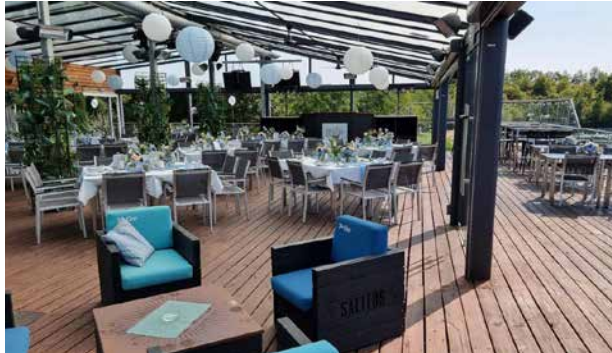
Rooftop Lounge, Beckum, 40 bis 200 Personen