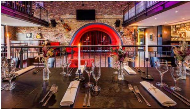
Shim Sham, Ahlen, 40 bis 80 Personen