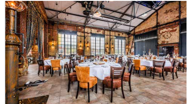
Lokschuppen, Ahlen, 100 bis 160 Personen