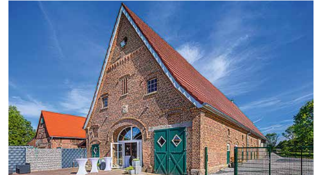
Gut Eickholt, Werne, 40 bis 90 Personen