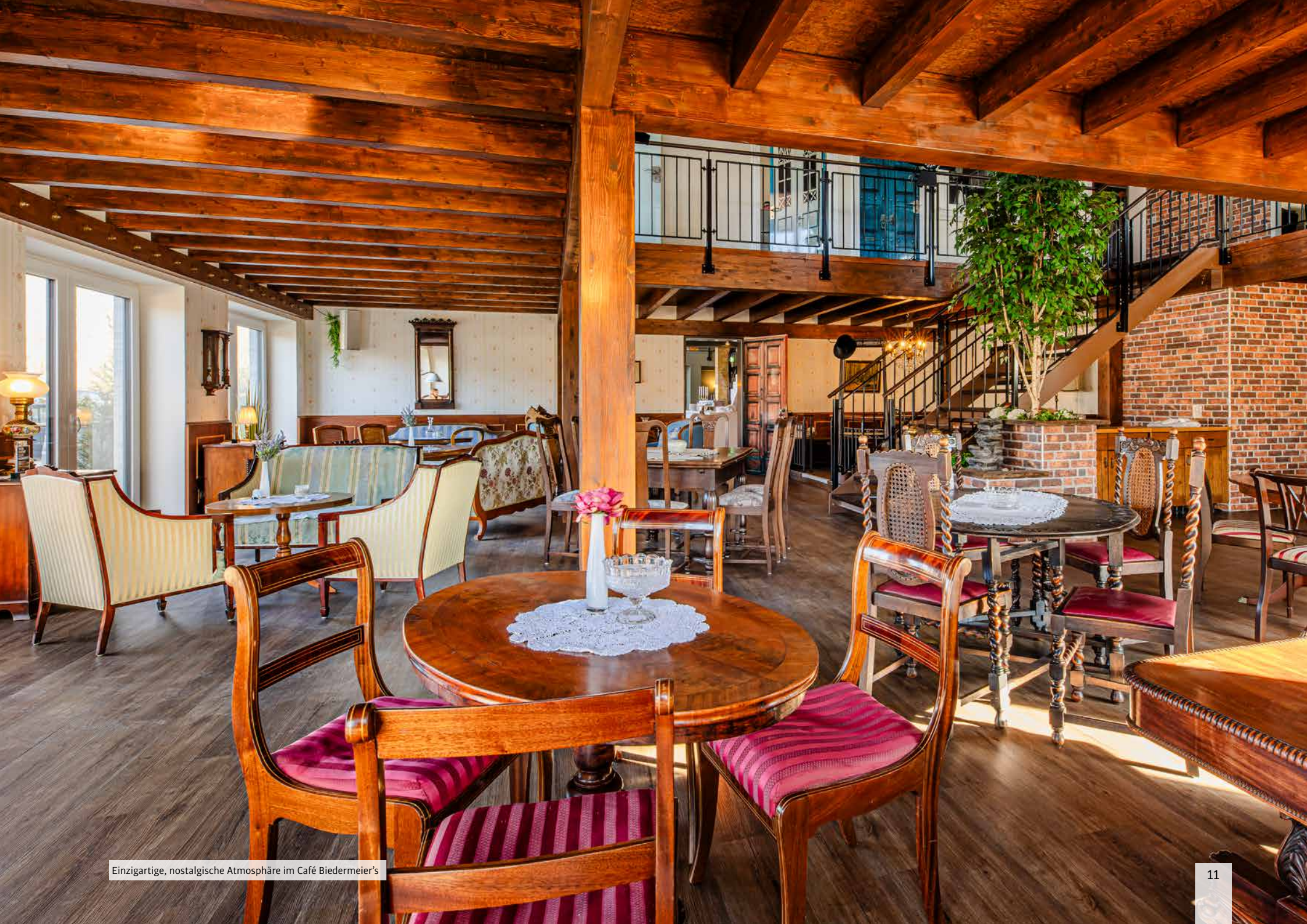
Einzigartige, nostalgische Atmosphäre im Café Biedermeier's