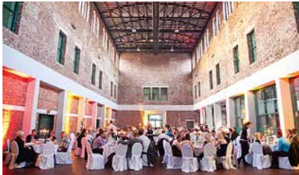
Alte Kau, Dortmund, 100 bis 500 Personen