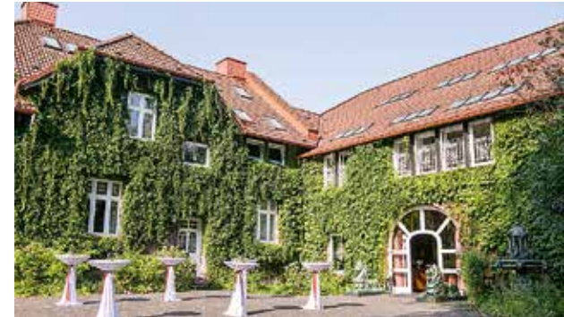
Rittergut Haus Laer, Bochum, 40 bis 140 Personen