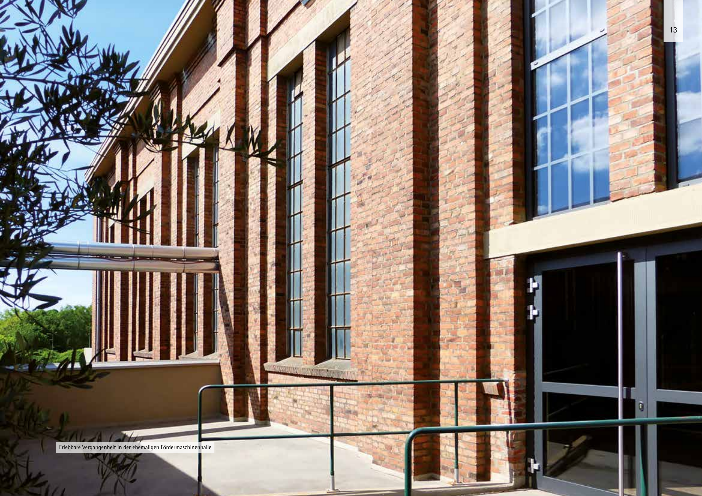
Erlebte Vergangenheit in der ehemaligen Fördermaschinenhalle