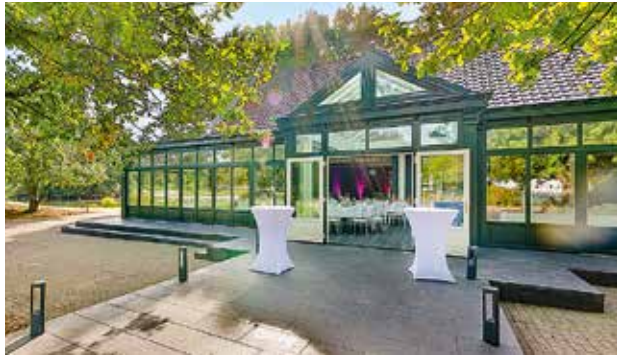
Festscheune am Ümminger See, Bochum, 60 bis 120 Personen

Weitere außergewöhnliche Locations finden Sie auf www.stolzenhoff.de