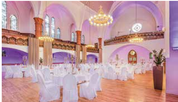
Eventkirche Dortmund, 90 bis 300 Personen