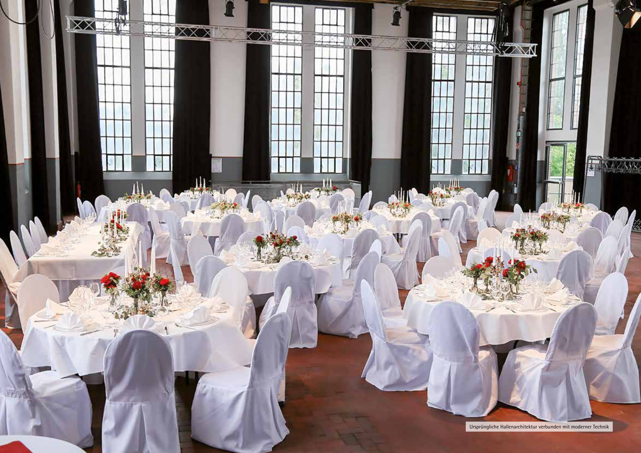
Ursprüngliche Hallenarchitektur verbunden mit moderner Technik