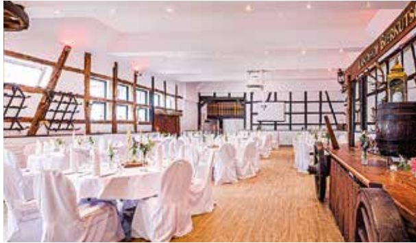
Landhof Kemnader See, Alte Scheune Bochum, 50 bis 140 Personen