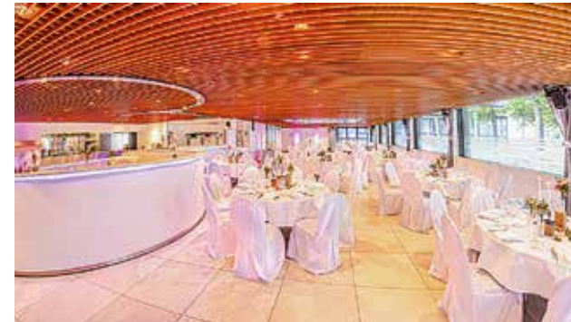
Eventforum Castrop-Rauxel, 40 bis 120 Personen